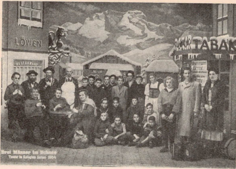
Auf dem Dorfplatz von Schneebligen

tet werden; durch den ganzen Marsch habe sich die Linie eines straffen und präzisen Rhythmus gezogen und es sei eine der schönsten Tagesleistungen in Kerns gewesen. Auch der Vortrag des Konzertstückes in der Festhalle fand aufmerksamste Zuhörer und wiederum die volle Anerkennung des Experten. Dieser lobte die zweckentsprechende Wahl des Stückes, die gute Besetzung der einzelnen Register, das flotte und beherrzte Spiel der Jugendlichen, das er ausgeglichen nannte. Ein besonderes Kränzchen wand er den Bässen! Wer möchte es dem Dirigenten und den Bläsern verargen, daß sie sich über ihren schönen Erfolg freuten? Das Lichtbild auf Seite 75 zeigt die Studentenmusik am Musikfest in Kerns.